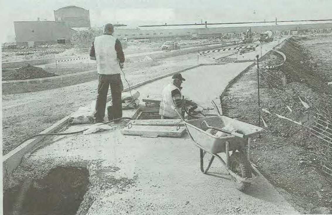
► Imagen de archivo de las obras de urbanización de Estepark, que ya han finalizado.

Se acelera de esta manera un proyecto que necesitaba del dictamen favorable de la Conselleria