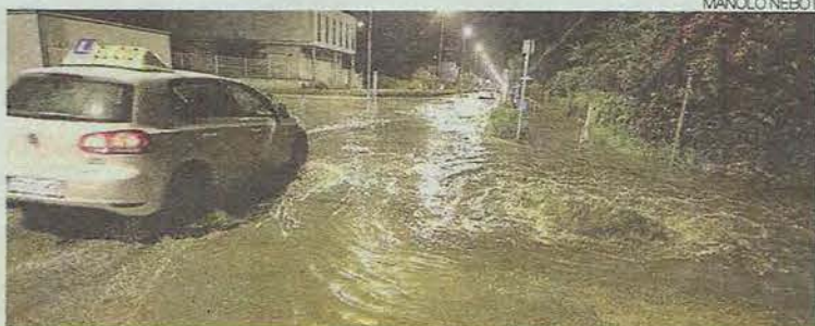
Un vehículo circula junto a una alcantarilla rebosante de agua.

La tormenta deja 20 litros/m 2 y anega calles, pero se queda en un diluvio pasajero en la provincia