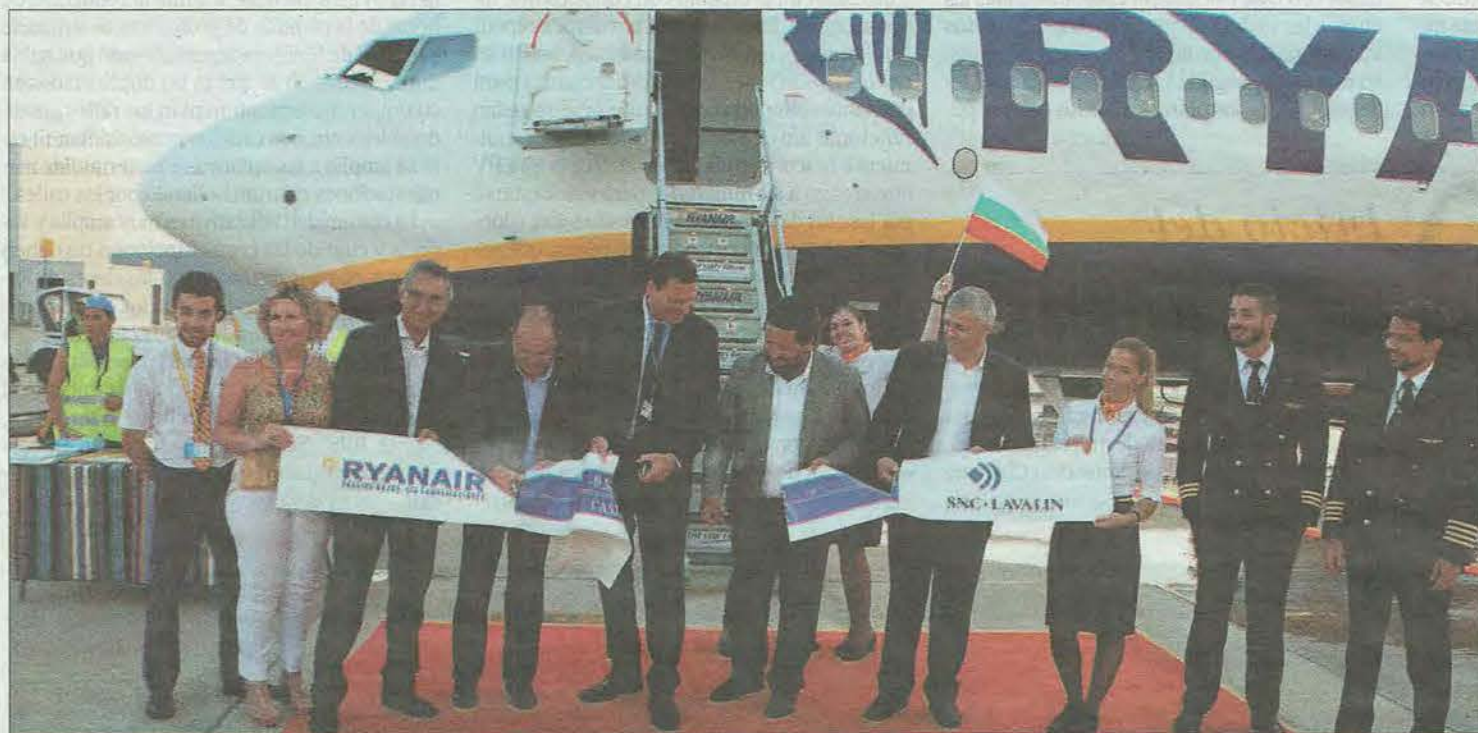
El avión procedente de Sofía (Bulgaria) que inauguró ayer la ruta llegó prácticamente lleno a Castellón. JOSÉ GÓMEZ

sente ejercicio en las comarcas castellonenses corresponden a vivienda de segunda mano (3.185) con incrementos del precio del 3,2% en el segundo trimestre. PÁGINA 3