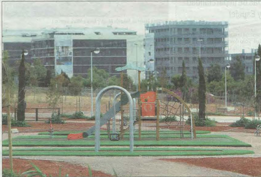
Los terrenos que albergarán el parque comercial Estepark están completamente urbanizados y equipados.

35.000 METROS CUADRADOS Parcela. El parque se extenderá sobre 43.000 m 2 y de ellos, 35.000 m 2 ocuparán las dotaciones comerciales