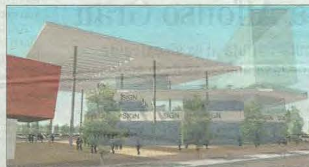
Recreación virtual del edificio del parque Estepark.