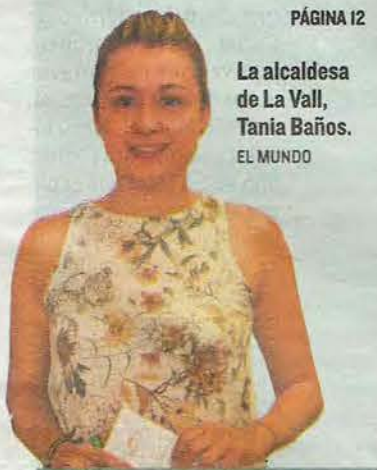
La alcaldesa de La Vall, Tania Baños.