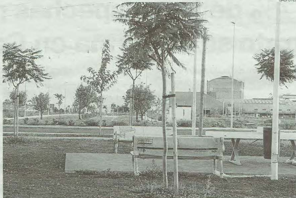
► Superficie ya urbanizada donde se construirá el futuro parque comercial Estepark.

"En este caso la ley no nos da margen alguno, tenemos que autorizar sí o sí porque no podemos prevaricar"