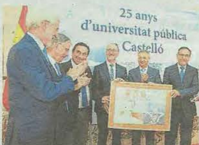
Homenaje a rectores y políticos impulsores en el 25º aniversario

La UJI se reivindica como motor de transformación social y económica