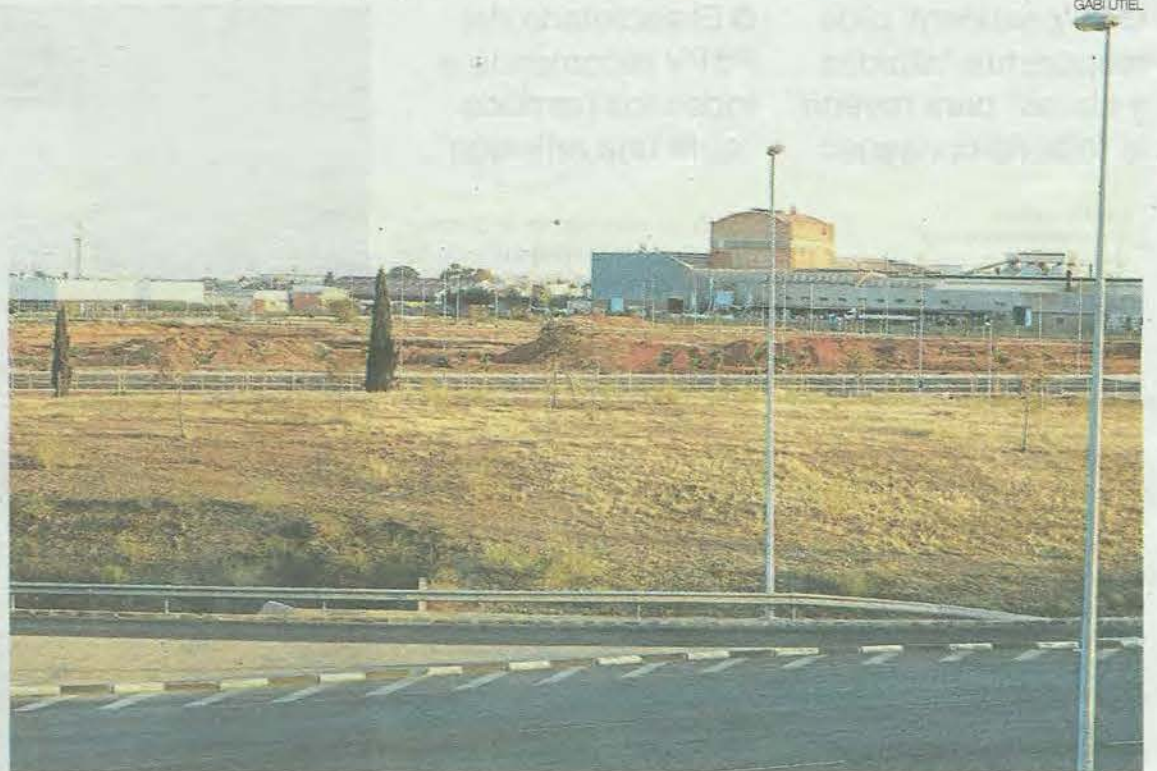
Imagen de los terrenos ya urbanizados, donde irá el futuro centro comercial de Estepark, ayer.

MÁS INFORMACIÓN Y SUGERENCIAS www.elperiodicomediterraneo.com Contestador: 964214322 - Buzón: 25511 CONT