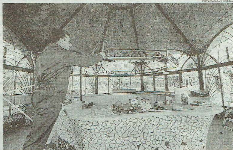
Trabajos de acondicionamiento del interior del quiosco.

SIN PLAZOS // Distinta es la situación para el otro quiosco emblemático de la ciudad, el de la plaza