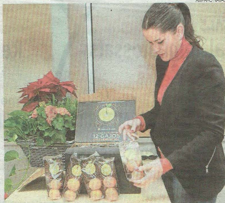
► Castellón promociona el consumo de cítricos en Nochevieja.

PARA LOS VECINOS // Asimismo, desde el Ayuntamiento de Castellón también han manifestado que repartirán en esta ocasión hasta 10.000 bolsas con 12 gajos de clementina. Del total, 2.000 se entregarán a pie de calle el mismo 31 de diciembre en la plaza Mayor y en Quatre Cantons. ■