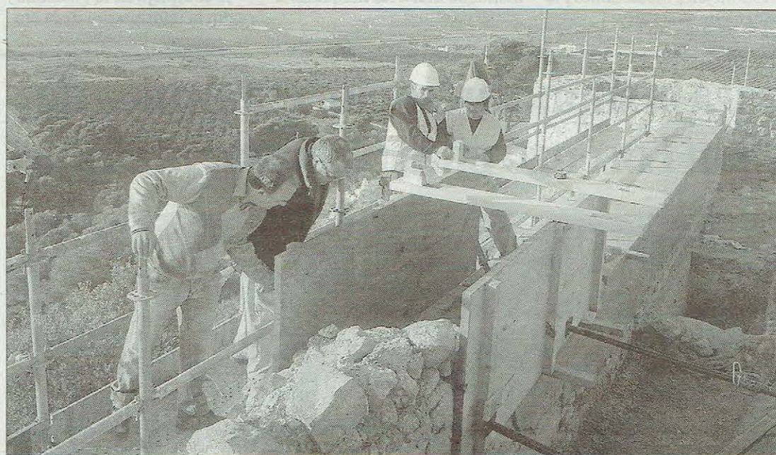
Los arquitectos responsables de la restauración en el Castell Vell.

La técnica se remonta a épocas púnicas y se ha desarrollado a lo largo de la historia en diferentes zonas geográficas del mundo y muy especialmente alrededor del Mediterráneo. La técnica tradicional del tapial consiste en construir una estructura o encofrado